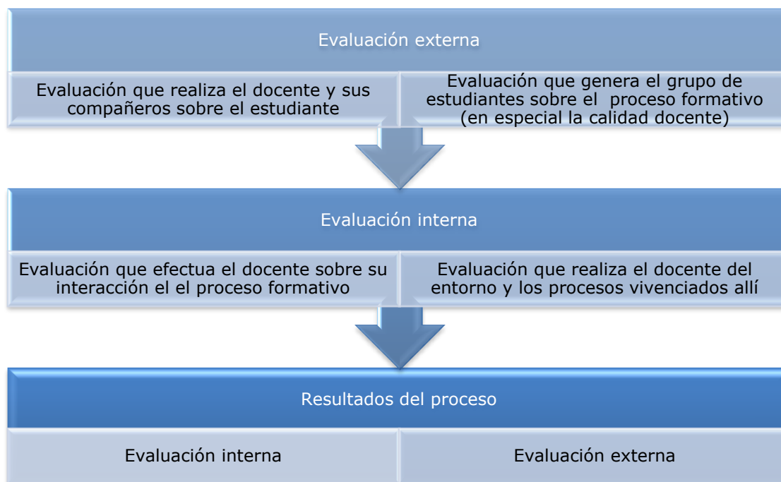
Figura 1. Sistemas de evaluación.

"Revista Virtual Universidad Católica del Norte". No. 34, (septiembre-diciembre de 2011, Colombia), acceso: [ http://revistavirtual.ucn.edu.co/ ], ISSN 0124-5821 - Indexada Publindex-Colciencias (B), Latindex, EBSCO Information Services, Redalyc, Dialnet, DOAJ, Actualidad Iberoamericana, Índice de Revistas de Educación Superior e Investigación Educativa (IRESIE) de la Universidad Autónoma de México.