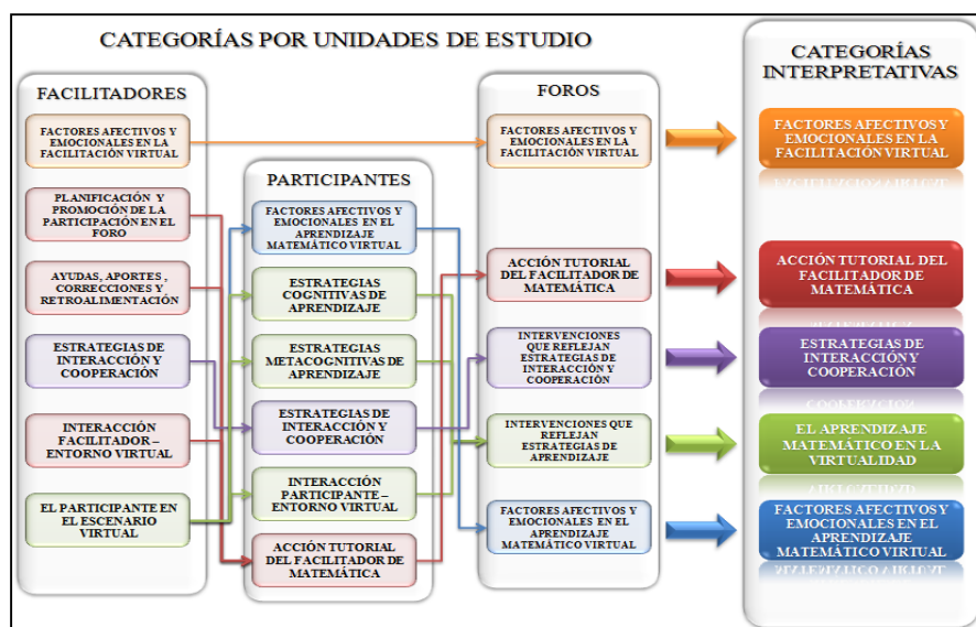
Figura 3. Cruce de categorías por unidad de estudio

En la figura 3 se observa la agrupación de las categorías por cada tipo de unidad de estudio, asociadas a un color específico: en “anaranjado” para los factores afectivos y emocionales en la facilitación virtual; en “rojo” para lo relacionado a la acción tutorial del facilitador de matemática en la virtualidad, en “morado” para las estrategias de interacción y cooperación; en “verde” para todo lo relacionado con el aprendizaje matemático virtual y en “azul” para los factores afectivos y emocionales en el aprendizaje matemático virtual. Esta metodología de trabajo facilitó al investigador la descripción de estas categorías, las cuales se convirtieron en el sustento básico para la construcción, en un tercer momento de la investigación, de un modelo teórico-explicativo en el que se definen las interacciones entre el facilitador, el participante y los saberes matemáticos en la virtualidad; constituyendo la pretendida aproximación teórica sobre situaciones didácticas en el escenario virtual.