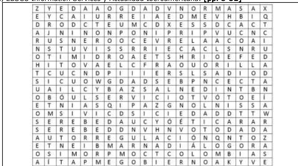
Figura 1. Sopa de Letras

"Revista Virtual Universidad Católica del Norte". No. 29, (febrero – mayo de 2010, Colombia), acceso: [ http://revistavirtual.ucn.edu.co/ ], ISSN 0124-5821 - Indexada Publindex-Colciencias, Latindex, EBSCO Information Services y Actualidad Iberoamericana. [pp. 8-32]