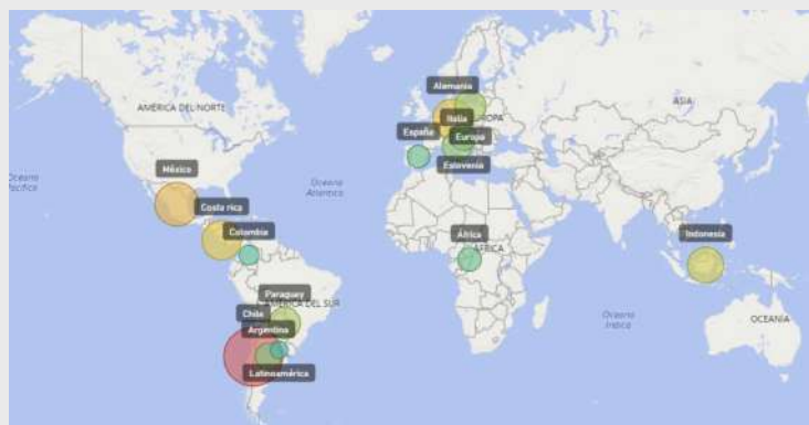
Figura 2. Diagrama coroplético para la relación entre categorías y países. Elaboración propia.

Con base en las puntuaciones obtenidas en las tablas 3 y 4, se procedió a ingresar los datos en el software Gephi; los resultados obtenidos se pueden observar en los mapas coropléticos desarrollados en el software Power Bi (Parks, 2014) de las figuras 2 y 3. En términos de las figuras, cuanto mayor sea el tamaño de la burbuja hay más estudios con categorías orientadas a aspectos metodológicos, es decir, mayores puntuaciones en las categorías C5, C6, C7, C8, C10, C13. En cuanto al color de la burbuja, va de tonalidad verde a roja, pasando por un intermedio amarillo, donde un color más rojo indica estudios con menos variedad en sus objetivos, y un color más verde indica estudios con más variedad de objetivos; la variedad de objetivos se relaciona con la existencia de estudios que contienen las categorías C1, C2, C3, C4, C9, C11, C12. Vale la pena resaltar que los índices de elaboración de los gráficos se definieron porcentualmente y relativizando la medida para evitar disparidades, debido a que en algunas regiones o países se analizaron más documentos que en otras.