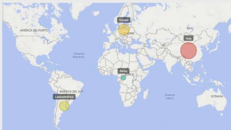
Figura 3. Diagrama coroplético para la relación entre categorías y regiones. Elaboración propia.