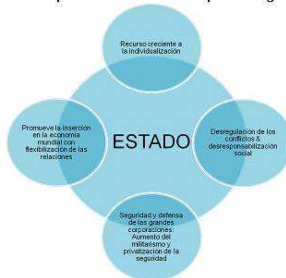
Figura 1. Papel estatal en tiempos de globalización

Fuente: Elaboración propia, Mary Luz Alzate 2010.